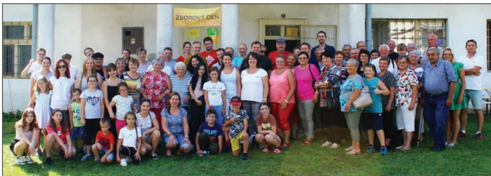
Účastníci tohtoročného zborového dňa.

Pobožnosť sa konala za účasti rodín z Pozdišoviec, Laškoviec a Močarian. Po skončení si prítomní ešte povinšovali a pochutili na dobrých medovníčkoch. Nechýbal ani teplý punč. Účastníci ochotne prispeli aj na „Dobrá novinu“. Pán Boh zaplať! MHP