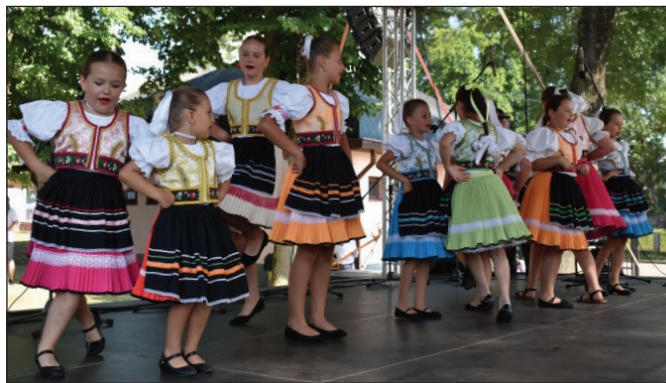
Aj tohtoročné folklórne slávnosti otvárali najmladší folkloristi z DFS Harčarik.