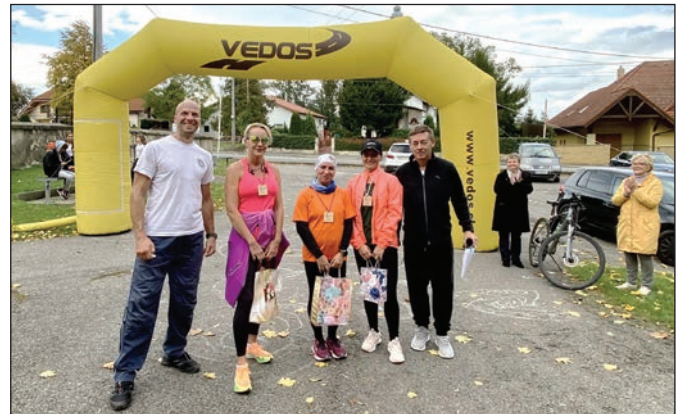
Z vyhodnotenia výsledkov Jesenného behu Pozdišovcami.

Po vyhodnotení a ocenení účastníkov preteku pokračoval športový deň cyklotúrou na trase od obecného úradu popri rybníku do obce Moravany a späť.