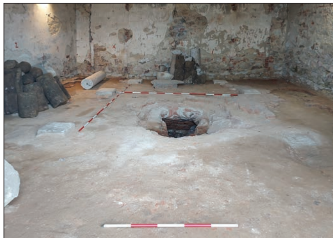
Pohľad do interiéru pohrebnej kaplnky Sirmajovcov.

Na základe doterajších výsledkov môžu ďalšie práce na záchrane kaplnky pokračovať. (red)