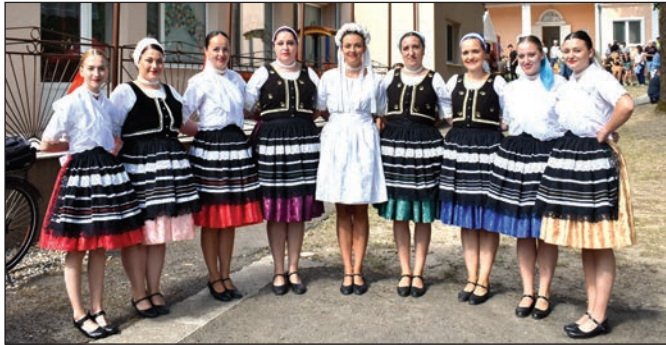
Úspešná FSK Harčarki.