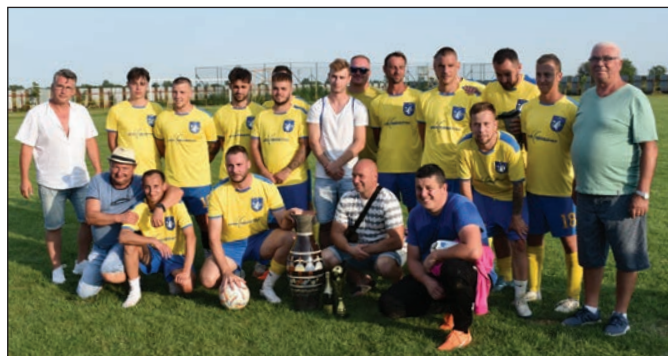
Futbalisti TJ Pokrok Krásnovce – dvojnásobní víťazi turnaja o Putovnú Pozdišovskú vázu.