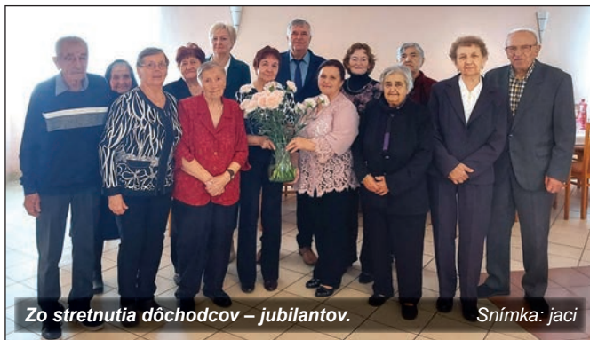
Zo stretnutia dôchodcov – jubilantov.

Počas všetkých troch dní pozdravila seniorov kultúrnym programom Folklórna skupina Čerkočky pod vedením Ondreja Nováka ml., ktorá pracuje pri Základnej umeleckej škole v Michalovciach. Milan Pozdišovský