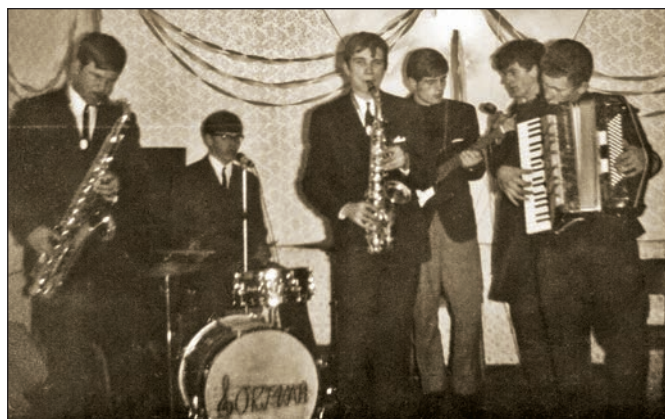
Hudobná skupina Ortvaň.

Palín 865, 25. Jovsa 838, 26. Ložín 829, 27. Iňačovce 825, 28. Vysoká n/U 786, 29. Sliepkovce 760, 30. Staré 755, 31. Laškovce 745, 32. Senné 737, 33. Hatalov 731, 34. M. Vojkovce 705, 35. Slavkovce 705, 36. Stretava 699, 37. Bánovce n/O 697, 38. Oborín 692, 39. Dúbravka 674, 40. Tušice 668, 41. Falkušovce 662, 42. Krásnovce 640, 43. Šamudovce 620, 44. Ruská 609, 45. Poruba p/V 606, 46. Lúčky 603, 47. V. Slemence 588, 48. Trnava p/L 586, 49. Zbudza 535, 50. T. N. Ves 524, 51. Kačanov 506, 52. Oreské 492, 53. Z. Kopčany 486, 54. Hažín 482, 55. Bajany 463, 56. Ptrušká 461, 57. Závadka 456, 58. Lesné 451, 59. Kaluža 442, 60. Klokočov 409, 61. Suché 407, 62. Čečehov 385, 63. Beša 378, 64. P. Čemerné 366, 65. Kusín 345, 66. Č. Pole 336, 67. Jastrabie p/M 297, 68. V. Raškovce 287, 69. Voľa 261, 70. Hnojné 232, 71. Budince 226, 72. M. Raškovce 222, 73. Petríkovec 191, 74. Stretávka 156 a 75. Ižkovec 91. (N. Pok)