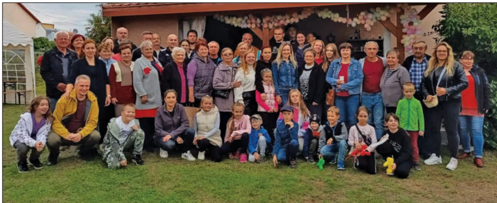
Účastníci tohtoročného zborového dňa.

Pamätnú tabuľu pri príležitosti 100. a 95. výročia narodenia biskupov venovala Košická eparchia a Konfederácia politických väzňov Slovenska. Spomienková slávnosť sa uskutočnila aj vďaka finančnej podpore Obce Pozdišovce. Pôvodne sa mala uskutočniť v roku 2021 (roku 100. a 95. výročia narodenia biskupov), ale pandemická situácia to znemožnila.