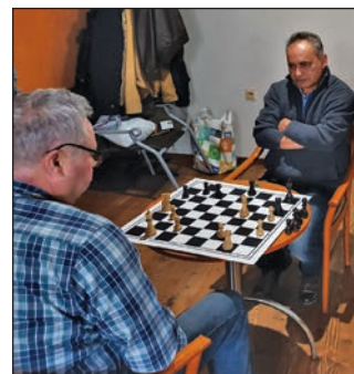
Pozdišovský šachový turnaj sa po nútenej pauze mohol v decembri opäť uskutočniť.