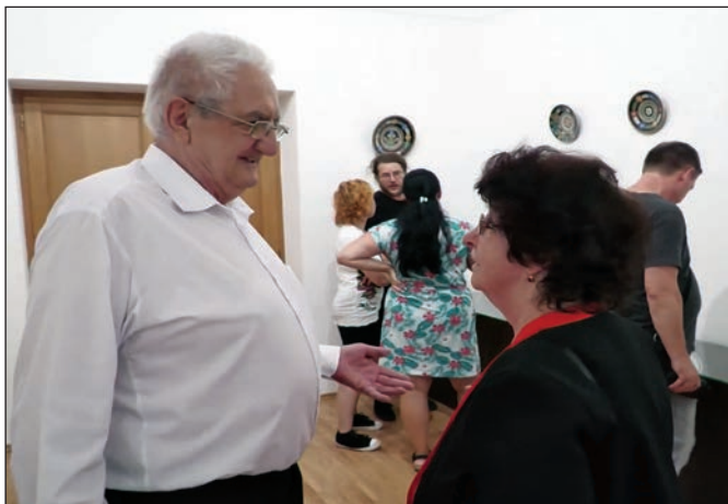
Záber z výstavy keramiky Parikrupovcov v ZM Michalovce.