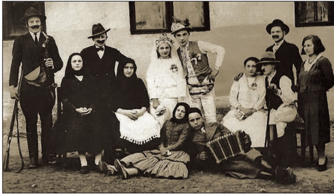
Pozdišovskí ochotníci pred deväťdesiatimi rokmi.