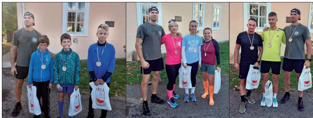
Z vyhodnotenia výsledkov VII. ročníka Jesenného behu obce Pozdišovce.

Po behu nasledovala cyklotúra krásnou prírodou až k obci Moravany a späť v celkovej dĺžke približne 11 km. Štart bol podobne ako pri behu od budovy obecného úradu. -PL-