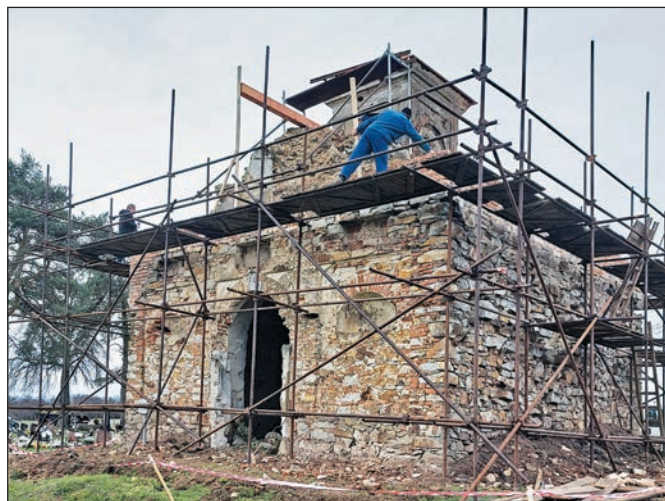
Pohľad na práce na kaplnke v závere roka.