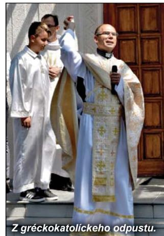
Z gréckokatolíckeho odpuštu.