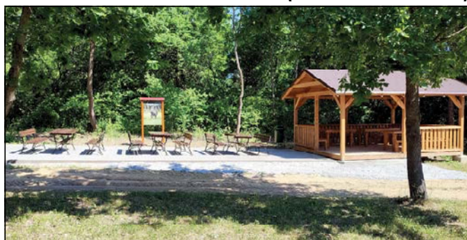
Novopostavený altánok pri poľovníckej chate.