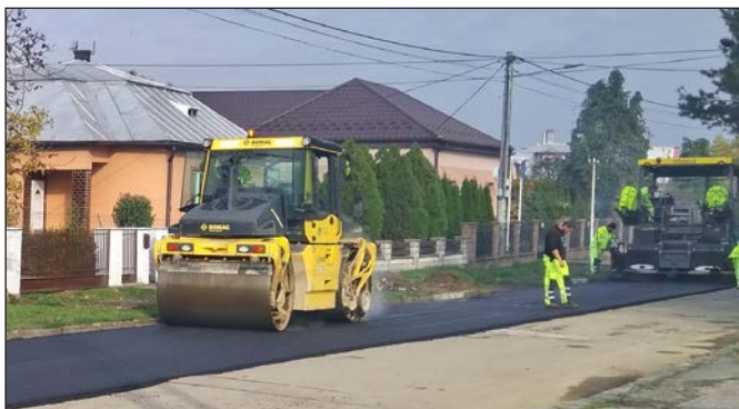
Po Školskej ulici sa už jazdí bezpečnejšie. Miestna komunikácia dostala v októbri novú asfaltovú pokrývku.