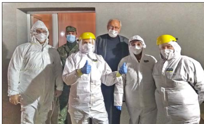
Počas prvého kola celoplošného testovania na COVID-19 sa v našej obci zastavil aj minister pôdohospodárstva Slovenskej republiky Ján Mičovský .